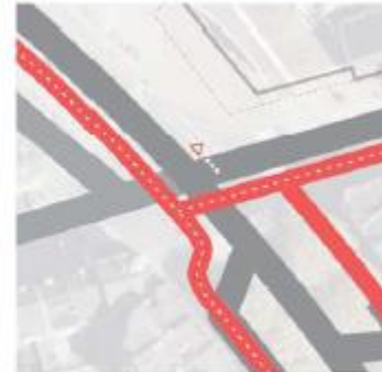
2-richting west + 2-richting zuid