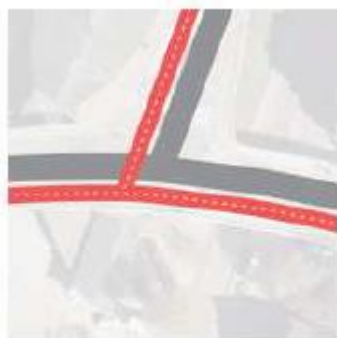
2-richting zuidzijde + 2-richting westzijde

voorrang op het afslaande gemotoriseerde verkeer. Dit leidt geregeld tot wachtrijen en dat leidt weer tot het nemen van risico's door even snel over te steken of door het verkeerd inschatten van verkeer. Een tweerichtingen fietspad aan de zuidzijde van de brug haalt deze conflicten weg. Fietsers kruisen alleen nog de relatief rustige stroom van verkeer dat de brug op mag rijden.