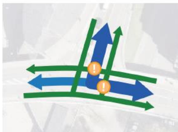
Afbeelding 3.3: Routes en conflicten op kruispunt Wilhelminasingel - Franciscus Romanusweg

Een twee-richtingen fietspad zorgt voor een overzichtelijke inrichting van het kruispunt Wilhelminasingel – Franciscus Romanusweg. Hierdoor kunnen de belangrijkste knelpunten tussen doorgaande fietsers en afslaand gemotoriseerd verkeer worden opgelost. Op dit kruispunt nemen mensen risico's. Dit komt doordat de meeste fietsers van Wilhelminasingel naar Wilhelminabrug en omgekeerd rijden, en van de Wilhelminabrug naar de Franciscus Romanusweg en omgekeerd, terwijl het gemotoriseerde verkeer afslaait van de Wilhelminasingel naar de Franciscus Romanusweg. De afbeelding hiernaast illustreert dit: de groene lijnen zijn fietsroutes, de blauwe lijnen gemotoriseerd verkeer en de cirkels met de uitroeptekens tonen de rijrichtingen die conflicteren met elkaar en die ervoor zorgen dat verkeer op elkaar moet wachten. Fietsers van Wilhelminasingel naar Wilhelminabrug hebben