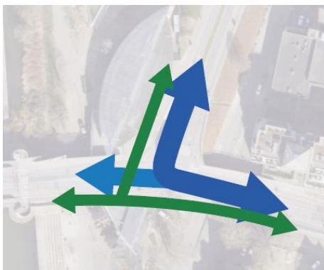
Afbeelding 3.4: Schematische weergave bouwsteen tweerichtingen fietspad op het kruispunt Wilhelminasingel - Franciscus Romanusweg