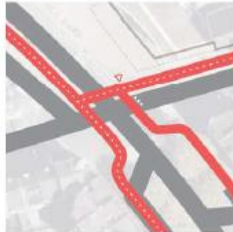
2-richting west + 2-richting noord