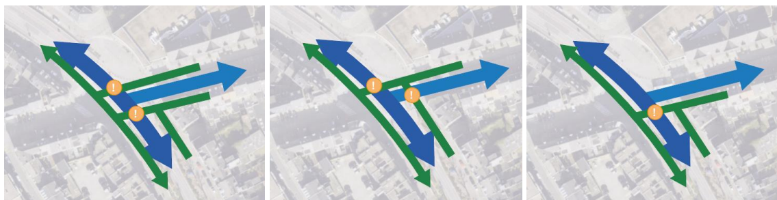
Afbeelding 3.5: Wilhelminasingel – Sint Maartenslaan 3 varianten met een tweerichtingen fietspad

Als dit tweerichtingen fietspad dat aan de zuidkant ligt, wordt doorgetrokken naar het kruispunt Wilhelminasingel – Sint Maartenslaan, zou dat betekenen dat alle fietsers van en naar het station de Wilhelminasingel moeten oversteken. Nu zijn dat alleen nog de fietsers die vanaf de brug komen die het kruispunt moeten oversteken. Ze kunnen echter geen voorrang krijgen, door de grootte van de verkeersstromen die gekruist moeten worden. In twee van de drie varianten op het kruispunt moet de OV-as (busroutes) worden doorkruist en dit tot kan tot ongewenste vertraging van het OV leiden.